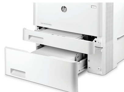
HP LaserJet Pro M452dn con vassoio carta opzionale da 550 fogli